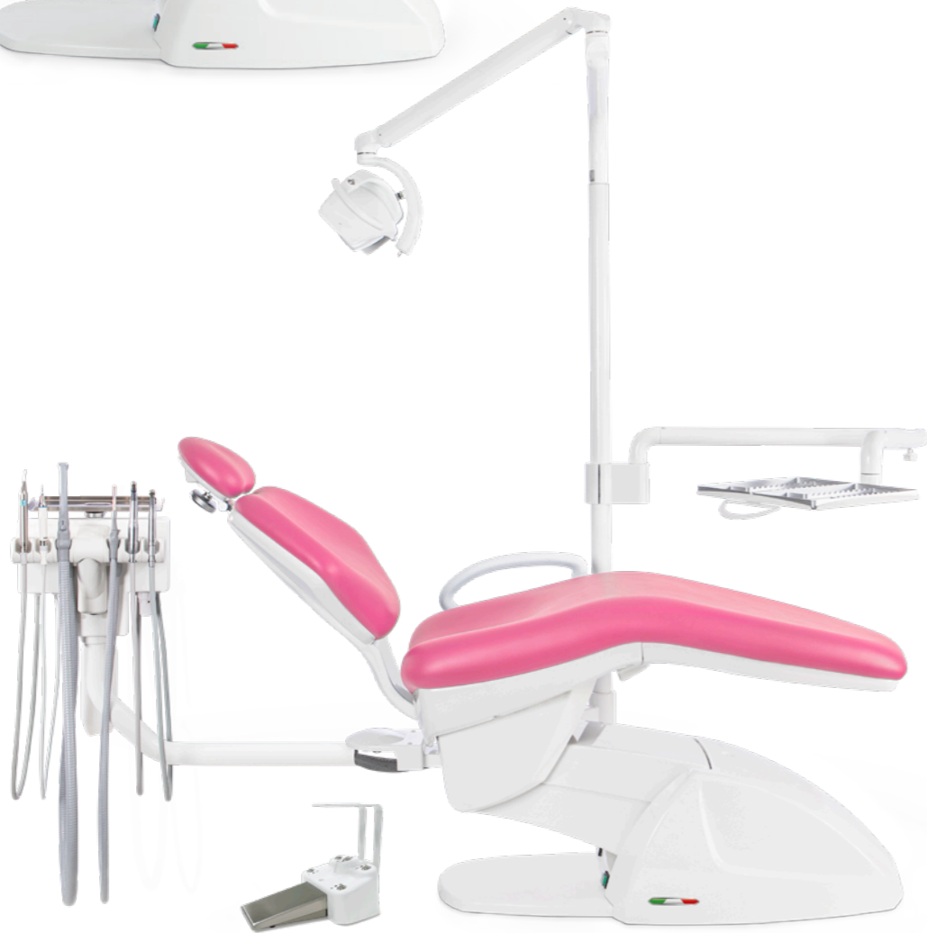
ISOFLEX MODULAR/ ORTHO